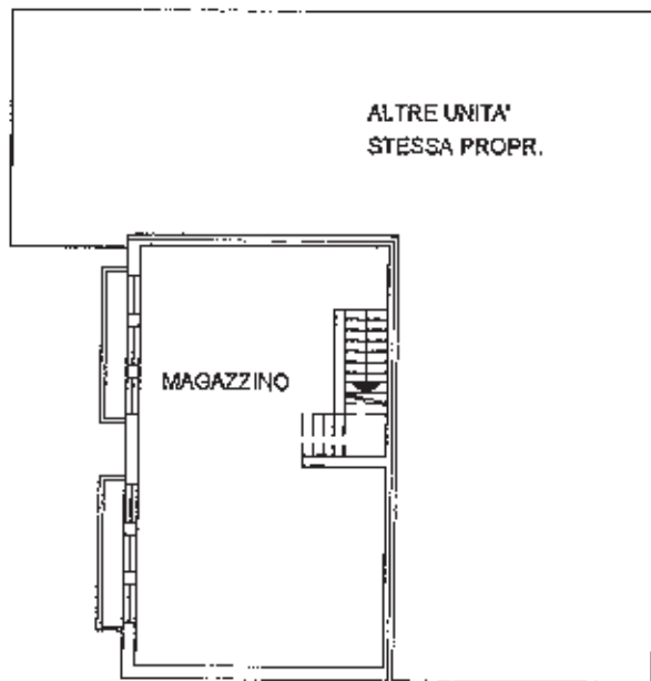
PIANO INTERRATO h. 2.40