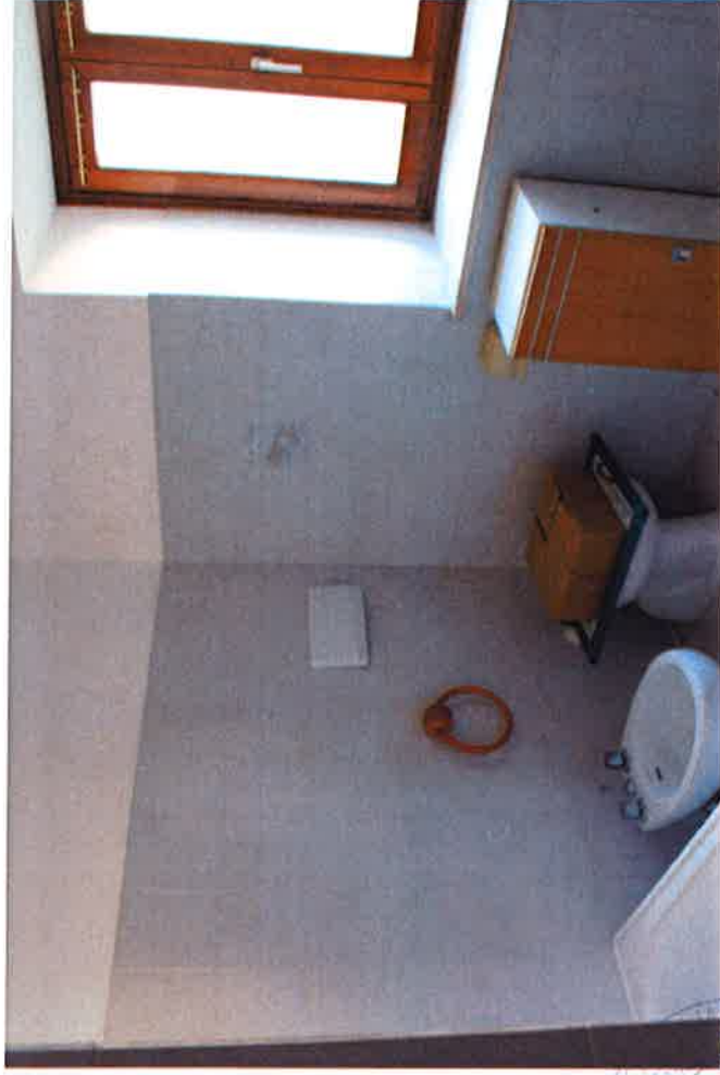
10 - Bagno