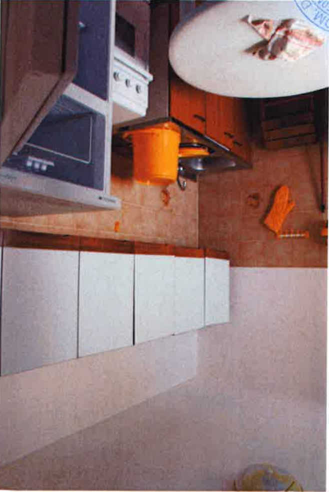
5 - Cucina