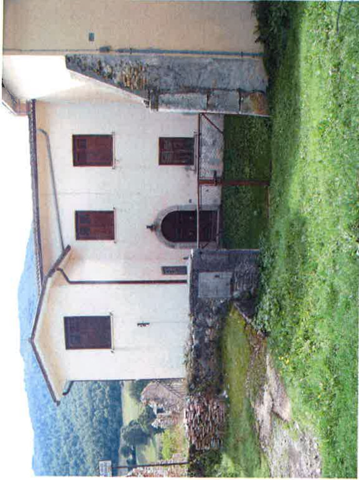
1 - Ingresso abitazione