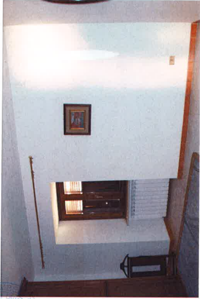
8 - Camera