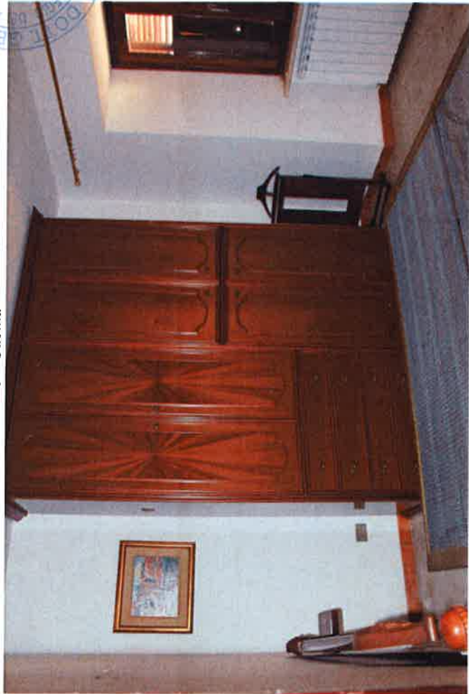
7 - Camera