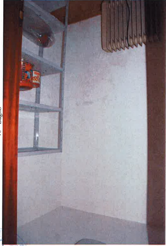
12 - Ripostiglio