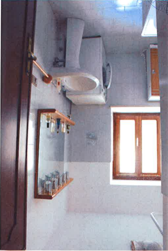
9 - Bagno