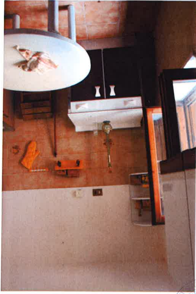
6 - Cucina