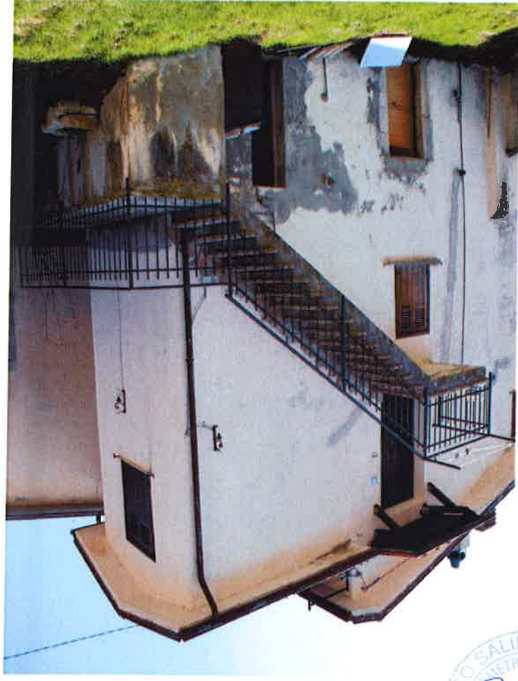
2 - Lato centrale termica