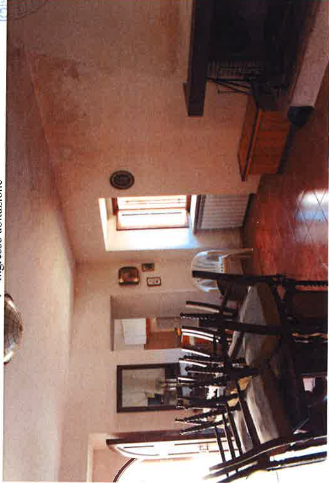
3 - Soggiorno