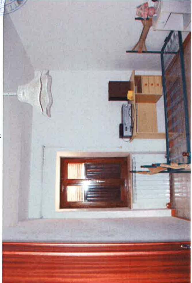
11 - Camera