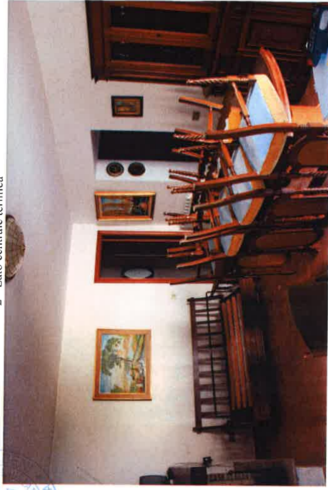
4 - Soggiorno