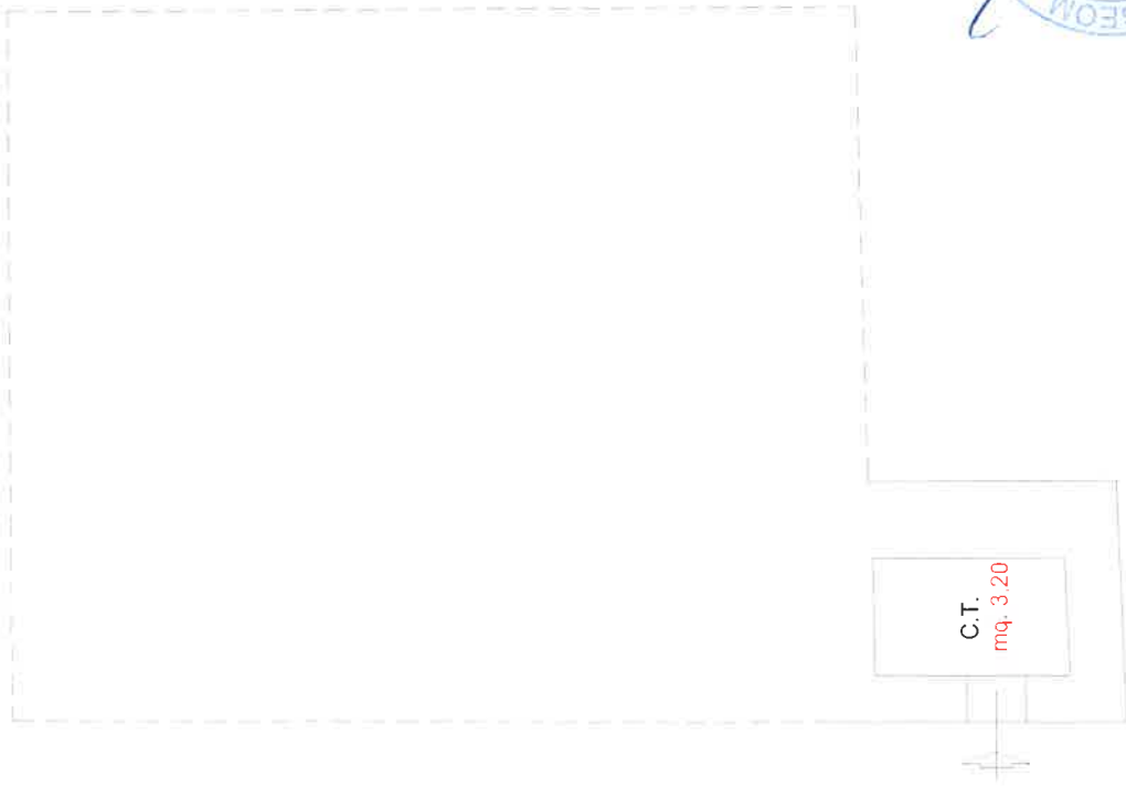
PIANTA PIANO SEMINTERRATO